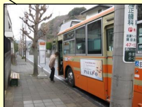
北鎌倉台バス停から徒歩1分