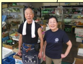
お向かいには八百屋さん