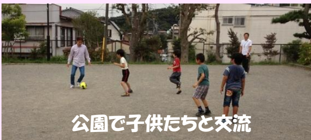
公園で子供たちと交流

生活療法…商店街の八百屋さんで買ったお昼の食材を職員と一緒に調理します。ちょっとしたサポートがあればできることは案外沢山あります。