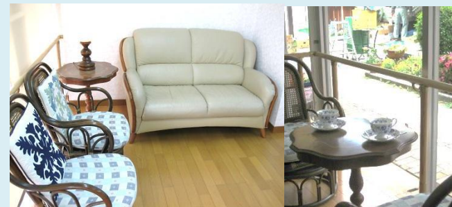
窓側の席からは商店街を眺める開放的。

写真は手作りの昼食です。メニューには馴染みのおかずを揃え、認知症の人にもわかりやすい食事です。