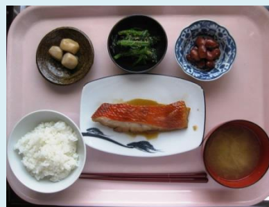
ご飯 みそ汁 煮魚 サラダ お浸し 煮豆 佃煮

写真は手作りの昼食です。メニューには馴染みのおかずを揃え、認知症の人にもわかりやすい食事です。