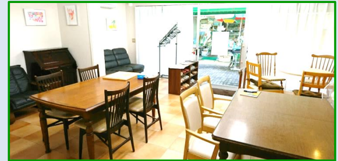
カフェのような雰囲気のリームです

開放的なテイルームは、ひとりひとりの個性を大切に考えたカフェ風な設計。外で働いた後は、心を癒す静かな空間であなたらしく、ゆったりと過ごしていただきます。