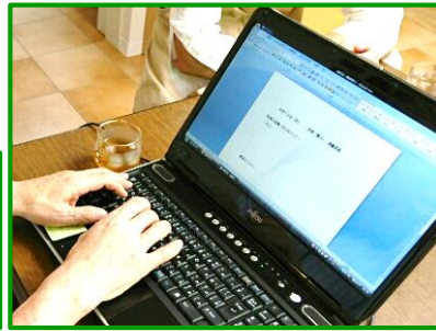
パソコンを使って日誌を書く人も！