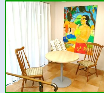
明るい絵画を飾った談話室

開放的なテイルームは、ひとりひとりの個性を大切に考えたカフェ風な設計。外で働いた後は、心を癒す静かな空間であなたらしく、ゆったりと過ごしていただきます。